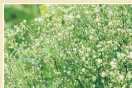
ヒメムカシヨモギ(65cm)