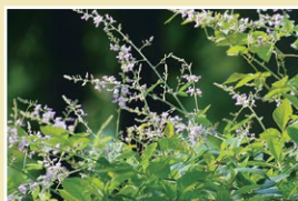
アレチヌスピトハギ(32cm)