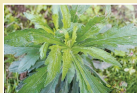
オオアレチノギク(25cm)