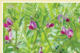
カラスノエンドウ(29cm)